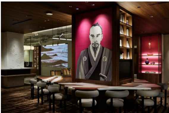
協創を生み出すサロンの場でもある CORDs