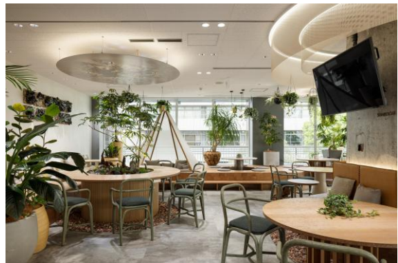
グリーンと自然光に包まれたウェルネスな空間 SUNROOM