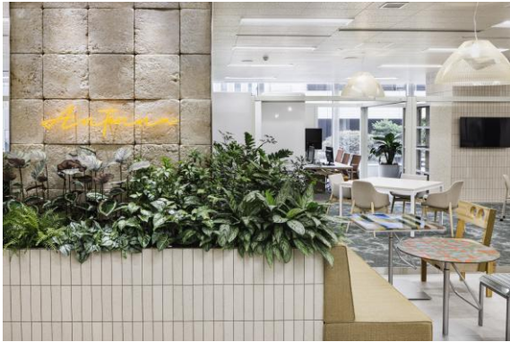
サステナビリティの視点を取り入れた ANTENNA