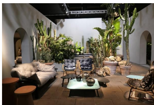
リゾート感のあるスタイル(Baxter)