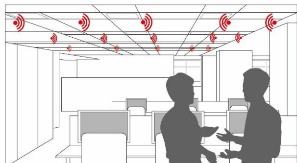
上図：センサーにより位置情報を把握

また、この「インテリジェントサーベイ」では、コミュニケーション測定以外にも「ワーカーの行動（運動量）」、「スペース利用状況」や、業務時間内の会議時間や集中時間の割合や時間帯といった「一日の働き方」などをデータ化することも可能としていきます。