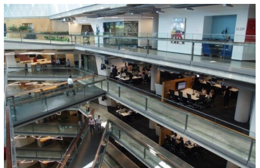
社内各部署を階段とブリッジで繋ぎコミュニケーションを向上 (ナショナルオーストラリア銀行/メルボルン)